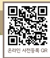
온라인 사전등록 QR